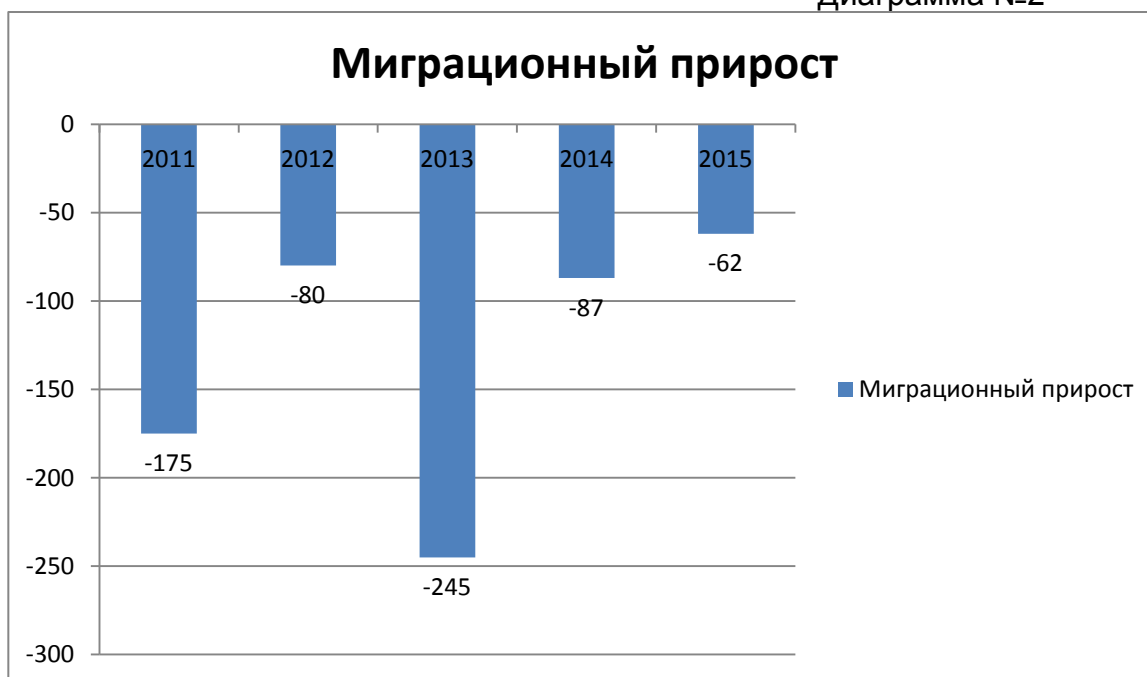
Прогноз миграционного прироста, убыли населения, чел Диаграмма №2

Таким образом, в перспективе коэффициент демографической нагрузки на трудоспособное население будет нарастать, увеличится численность людей пожилого возраста, начнет уменьшаться число женщин детородного возраста. Указанные процессы потребуют оперативного изменения в структуре здравоохранения, прежде всего в области охраны здоровья матери и ребенка, обслуживания лиц пожилого возраста, совершенствования медицинской помощи при заболеваниях, лидирующих в структуре смертности.