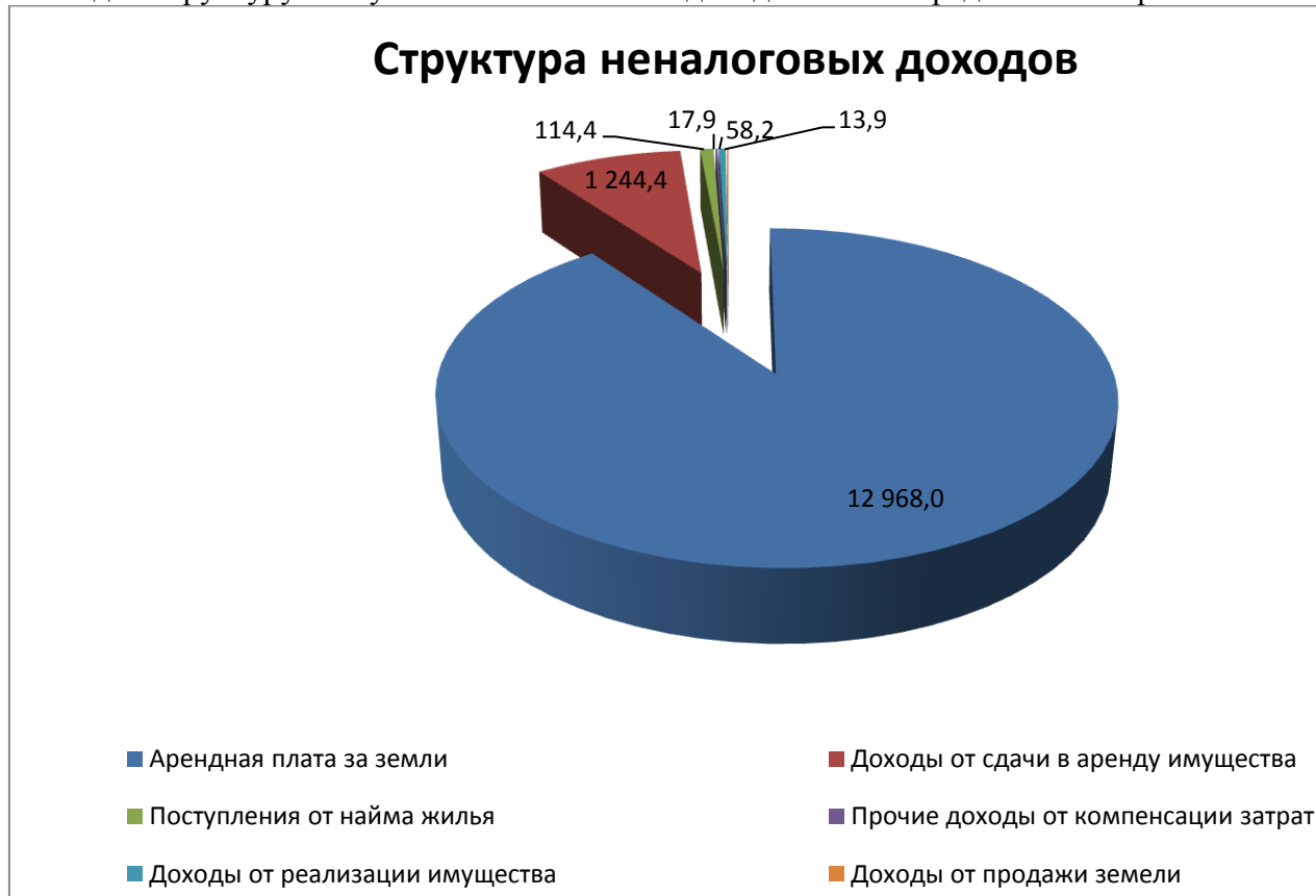
Рис. 3 Структура неналоговых доходов бюджета поселения

Наглядно структуру поступления неналоговых доходов можно представить на рис. 3