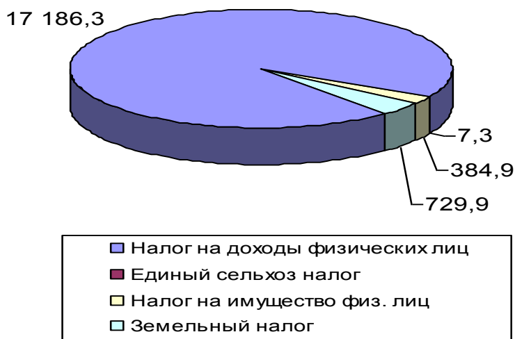
Рис. 1 Структура налоговых доходов бюджета поселения

Наглядно структуру поступления налоговых доходов можно представить на рис. 1