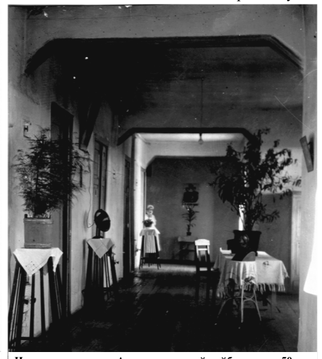
Интерьер коридора Александровской райбольницы 50-е г.