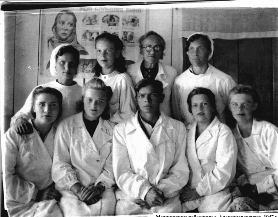
Медицинские работники с. Александровского, 1947 г.

Записала Анна ИВАНОВА