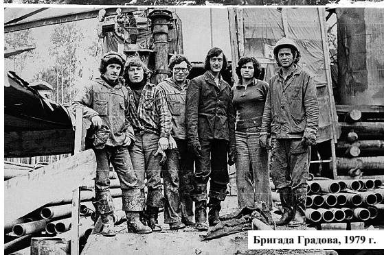
Бригада Градова, 1979 г.